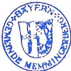
Lichtensteiger 1. Bürgermeister