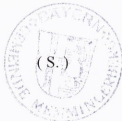
Lichtensteiger 1. Bürgermeister