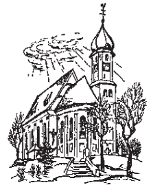
St. Johann Baptist