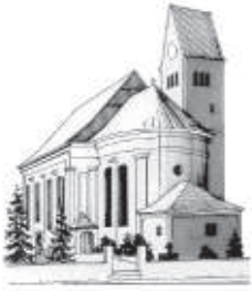
St. Peter u. Paul